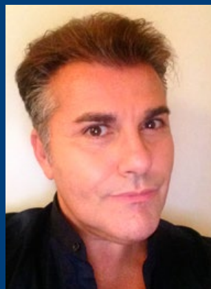
ANDREA BINETTI REGIA, SCENE E COSTUMI