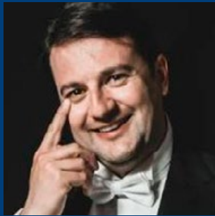
Tamino FRANCESCO NAPOLEONI TENORE