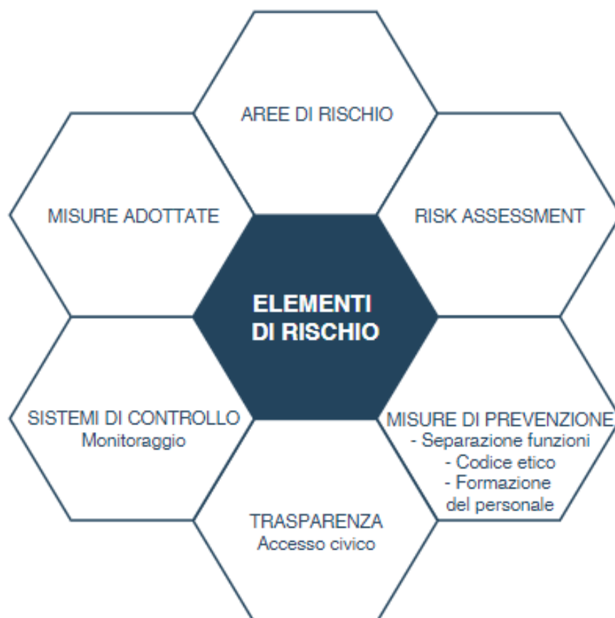
Schema - Elementi del Piano

Di seguito si riassume con uno schema esemplificativo.