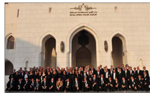
Royal Opera House Muscat (Oman)

prevladujeta nemška in slovanska tradicija, obenem pa večkulturnost Trsta izraža tako, da širši publiki približa dela skladateljev iz Srednje Evrope. V njem je bil Rossini prvič predstavljen mestu s predstavo L'Italiana in Algeri (1816), Donizetti z opero LAjo nell'imbarazzo (1826), Bellini z svojim delom Il Pirata (1831), Auber z La Muta di Portici (1832) in Thomas z delom Mignon (1870). Verdi se je tu prvič predstavil z uprizoritvijo opere Nabucco (11. januarja 1843), kateri so sledile še številne druge, večkrat takoj po svetovni premieri; Verdi je dve operni deli napisal za Novo gledališče, to sta Il Corsaro (25. oktobra 1848) in Stiffelio . Tržaško krstno predstavo te opere (16. novembra 1850) je Verdi sam uredil in vodil, glavno vlogo pa je pela prav Giuseppina Strepponi. Skozi vse leto je delovanje Fundacije opernega gledališča Giuseppe Verdi izredno pestro, saj ustanova oblikuje operno in baletno sezono ter bogato sezono simfonične, komorne in operetne glasbe. Izvedla je tudi mnoge turneje, ki zajemajo gostovanja v Spoletu (Festival dei Due Mondi), Wiesbadnu, Parizu, Ljubljani, Zagrebu, Budimpešti, na Japonskem (Tokio in Osaka), Cipru (Festival v Pafosu), v Južni Koreji (Seul) in v Omanu (Muškati).